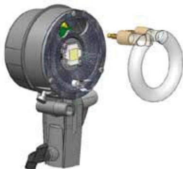
Głowica S Ranger Quadra Nr kat. 20107