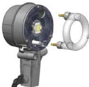
Głowica A Ranger Quadra Nr kat. 20110